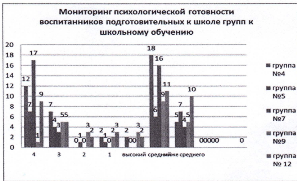
Распределение баллов по группам

В обследовании приняли участие 91 выпускник (группа №4 – 23 детей, группа №5 – 13 детей, группа №7 – 20 детей, группа №9 – 14 детей, группа №12 – 21 ребенок).